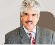
الدكتور مصطفى السيد