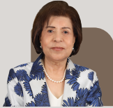
الدكتورة بهية الجشي